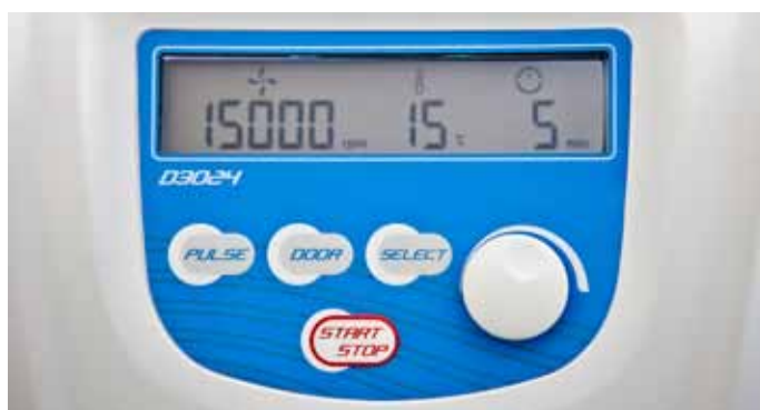
Display D3024 - D3024R