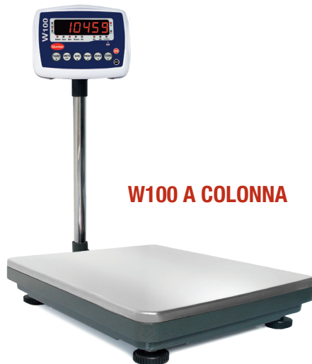
W100 A COLONNA