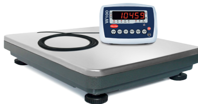
W100 A CAVO